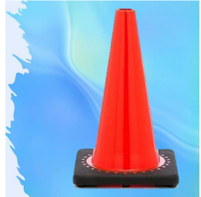
CONO VIAL 28"