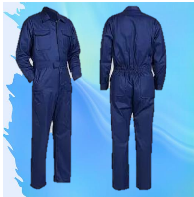
OVEROL USO GENERAL