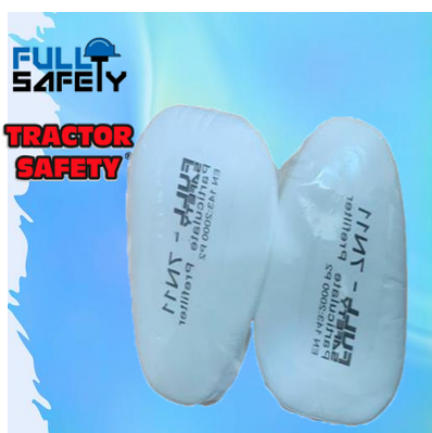
PRE FILTROS FS 7N11