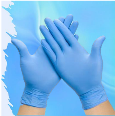
GUANTES DE NITRILO