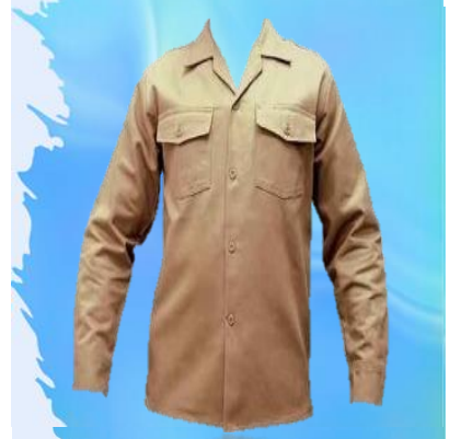
CAMISA KAKHI -LARGA