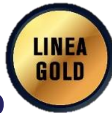
BOTAS DE SEGURIDAD MEDIA CAÑA MOD-710