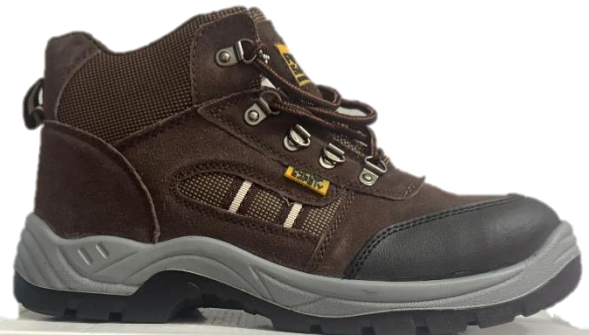
BOTAS DE SEGURIDAD SUPERVISOR FS 2065