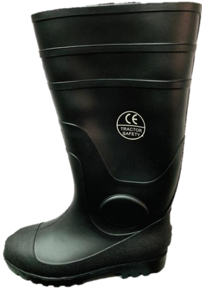
BOTAS DE PVC CAÑA ALTA CON PUNTERA