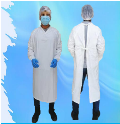
DELANTAL PVC- MANGAS