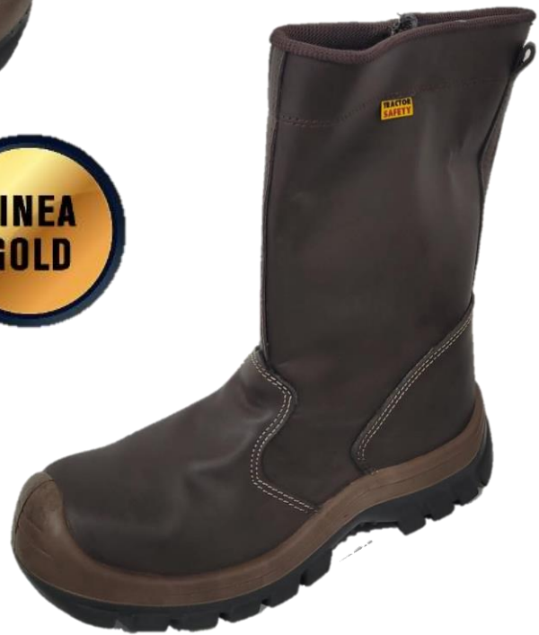
BOTAS DE SEGURIDAD SUPERVISOR GOLD