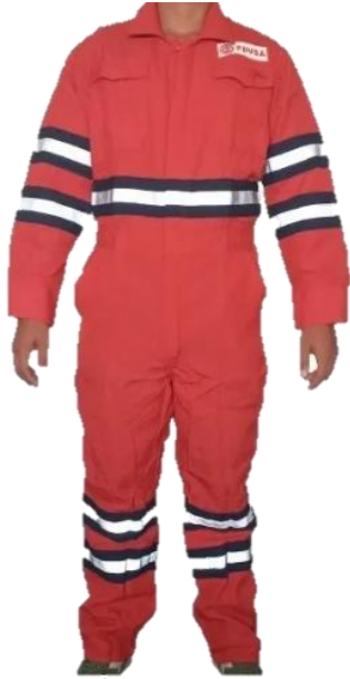
BRAGA INDUSTRIAL ALGODÓN IGNIFUGO