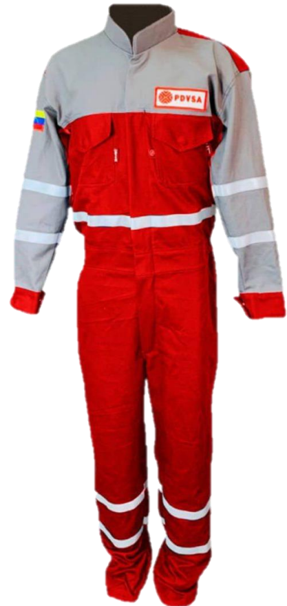
BRAGA INDUSTRIAL ALGODÓN IGNIFUGO