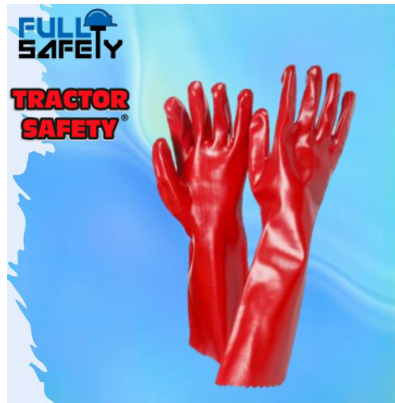
PVC ROJO 14"