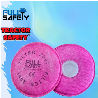
FILTROS FS 2001