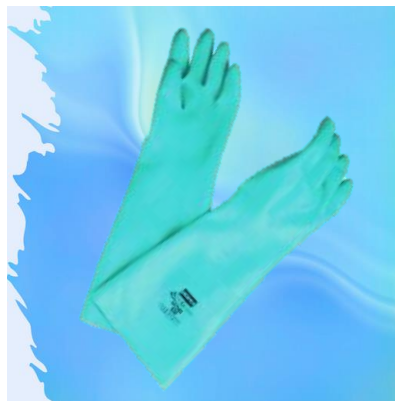
NITRILO VERDE 18"