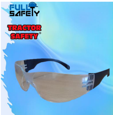
LENTE LM CLARO