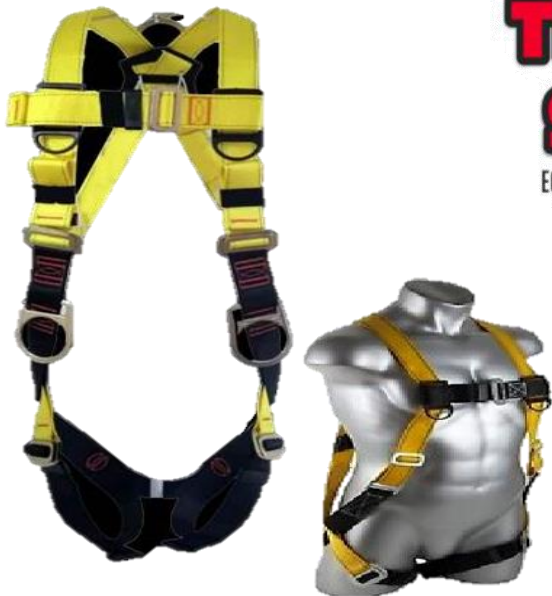
ÁRNES 3 ANILLOS

TRACTOR SAFETY® EQUIPOS DE SEGURIDAD INDUSTRIAL