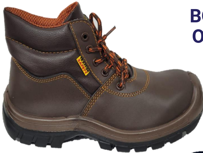
BOTAS DE SEGURIDAD OPERADOR GOLD-610