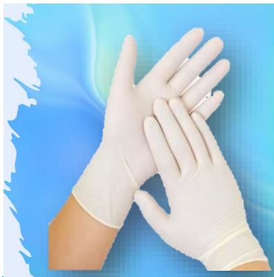
GUANTES DE LATEX