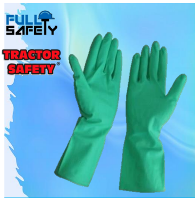
NITRILO VERDE 13"