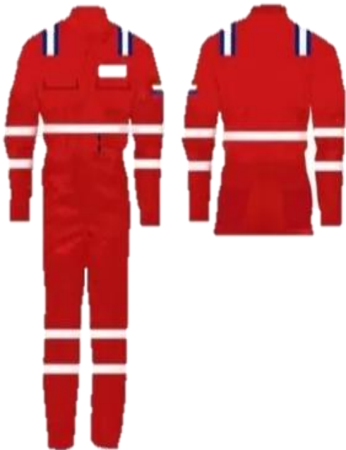
BRAGA INDUSTRIAL ALGODÓN IGNIFUGO