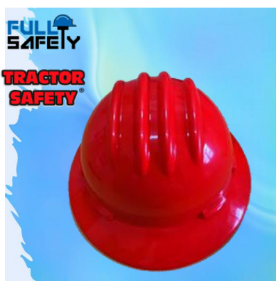
CASCO PONCHERA FS