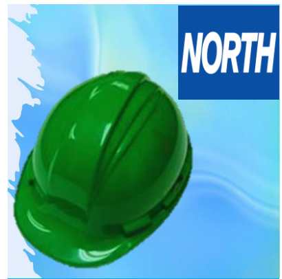
CASCO NORTH A59