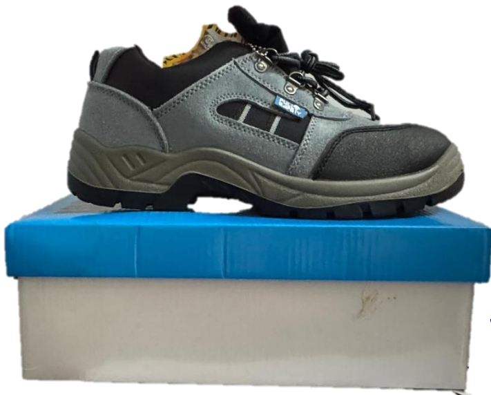
ZAPATOS DE SEGURIDAD SUPERVISOR FS 2066