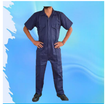
OVEROL USO GENERAL