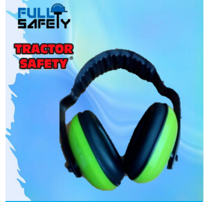
AUDIFONO 26 DB