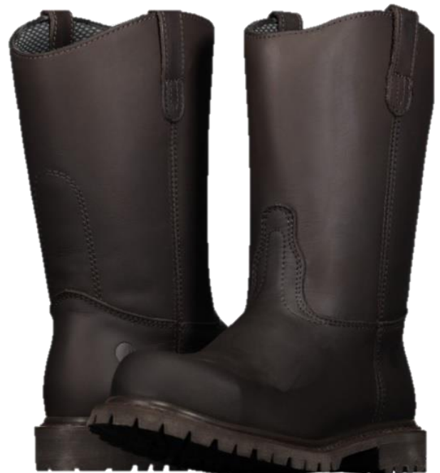
BOTAS DE SEGURIDAD MOD-160