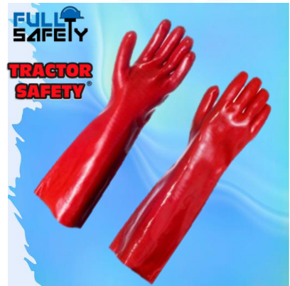
PVC ROJO 18"