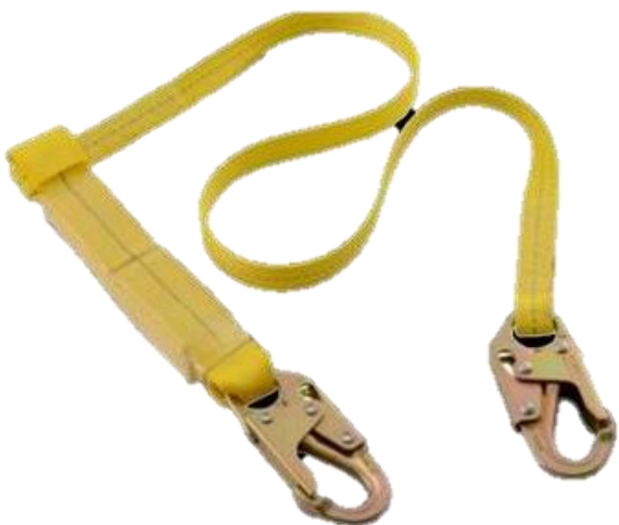
ESLINGA SENCILLA CON ABSORBER