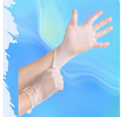
GUANTES DE VINILO