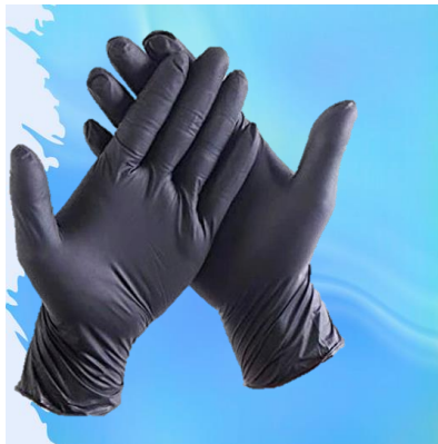
GUANTES DE NITRILO