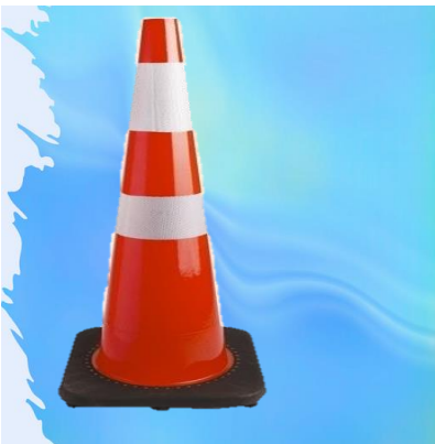
CONO VIAL 28"