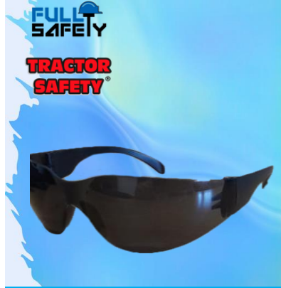
LENTE LM OSCURO