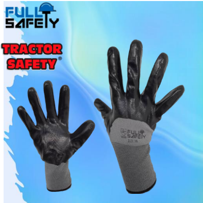
GUANTES DE PRECISIÓN