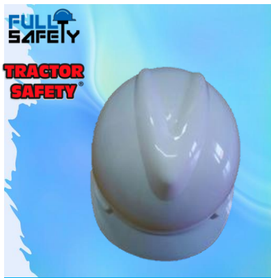
CASCO GORRA FS