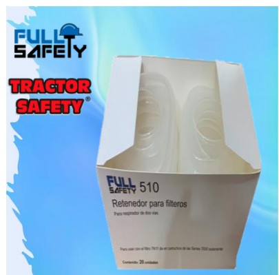
RETENEDOR FS 510