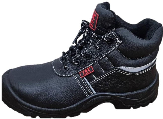
BOTAS DE SEGURIDAD OPERADOR FS 2050